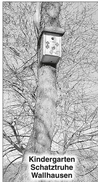
Kindergarten Schatztruhe Wallhausen

Die Kinder warten nun gespannt darauf, wann die ersten Bewohner in ihr neues Zuhause einziehen werden.