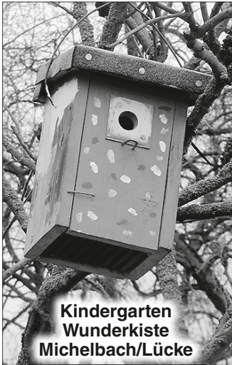
Kindergarten Wunderkiste Michelbach/Lücke