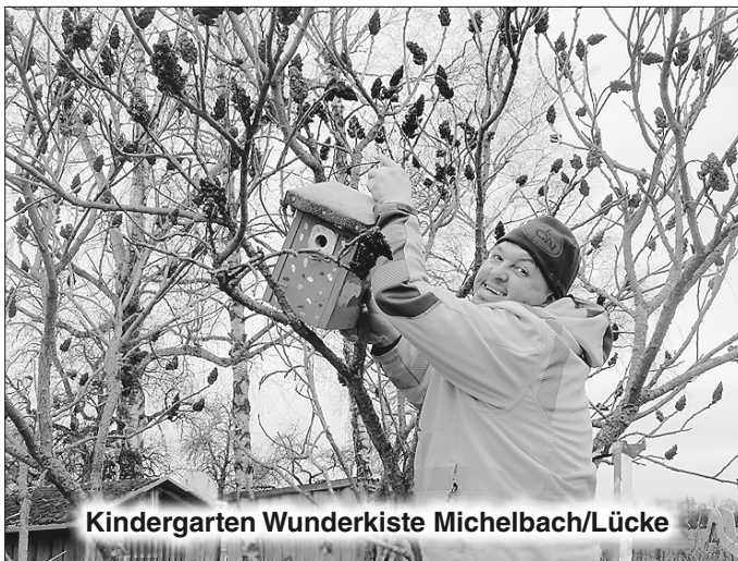
Kindergarten Wunderkiste Michelbach/Lücke

Ganz konkret wird eine nachhaltige Konsum-Alternative mit einer Kleidertauschparty umgesetzt. Trennen Sie sich von