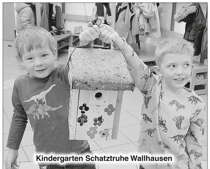
Kindergarten Schatztruhe Wallhausen