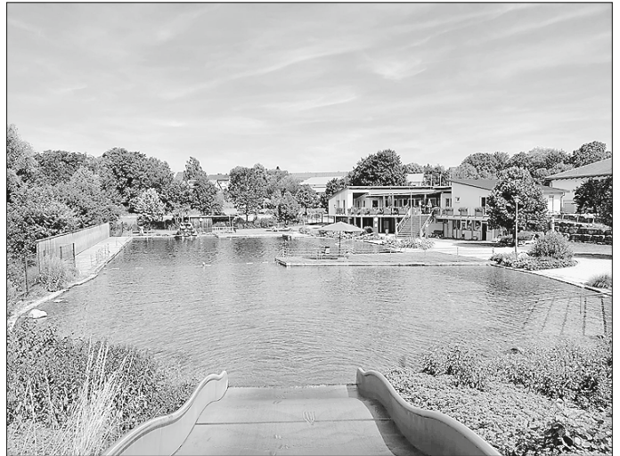
Das Naturerlebnisbad Wallhausen Geplanter Saisonstart: 18.05.2023