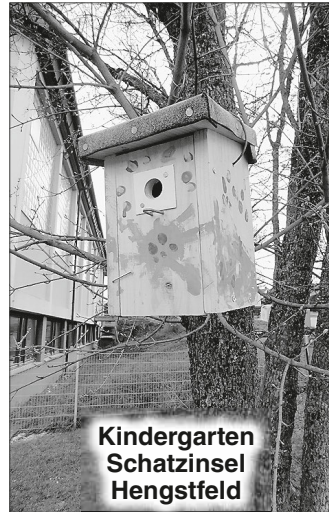
Kindergarten Schatzinsel Hengstfeld