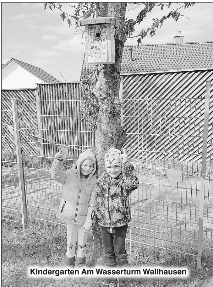
Kindergarten Am Wasserturm Wallhausen