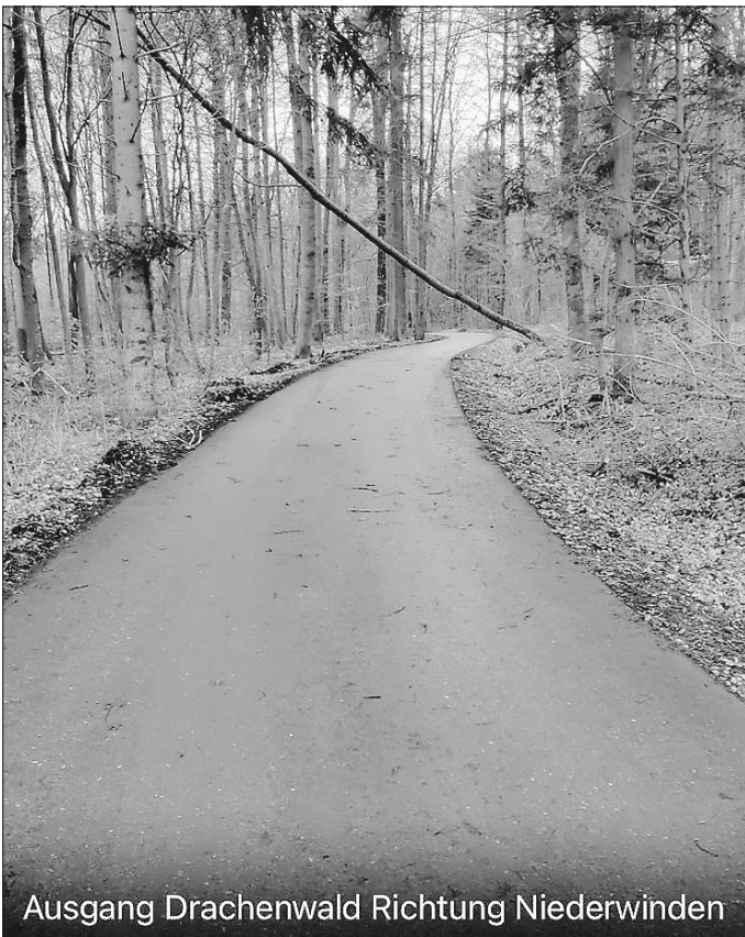
Ausgang Drachenwald Richtung Niederwinden