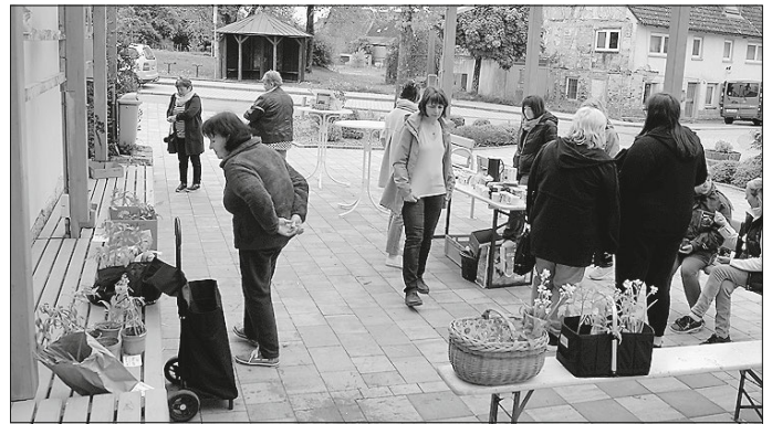
Was es wohl heute alles gibt? Noch ist der frisch beschickte Markt nicht eröffnet

Das ist aus berufenem Mund mehr als eine Anerkennung für diese Aktion der Naturhelden, deren Erfolg man spätestens im Herbst bei der Ernte zu sehen bekommt.