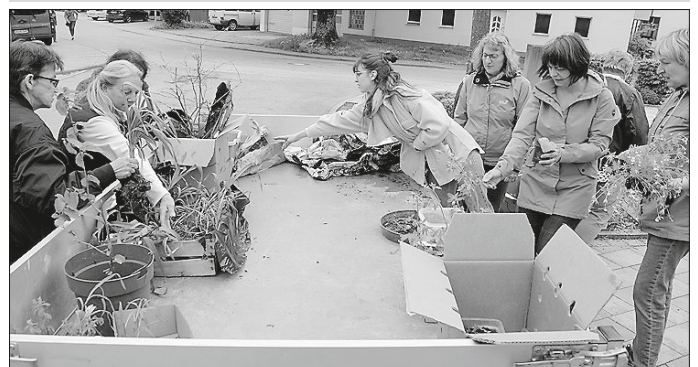
Auch direkt vom Anhänger darf man sich bedienen