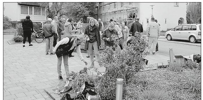
Pflanzentauschmarkt heißt: Sehen, sich beraten lassen und dann mitnehmen, bevor der oder die Nächste kommt