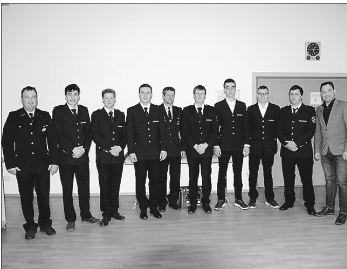
Auf dem Foto fehlt Markus Utz